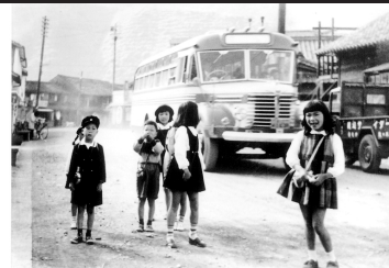
入選 片島での一コマ